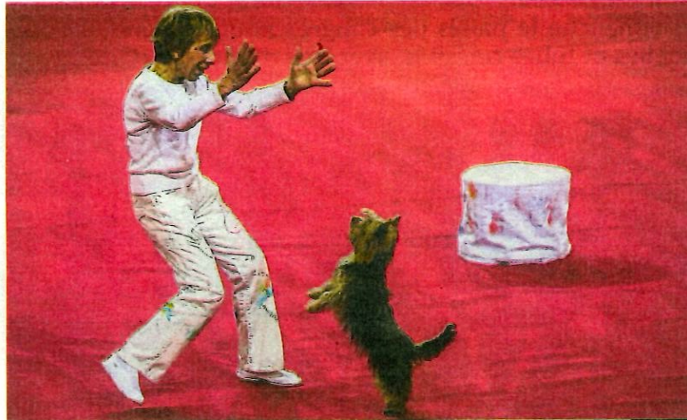
Après L'Acclameur à Niort en 2016, les Deux-Sèvres accueilleront de nouveau une compétition nationale de « dog dancing » à Bocapole.

La partie dédiée au concours sera « sacralisée », selon les termes de la présidente. Aucun bruit, nourriture et sonnerie de téléphone portable ne seront tolérés. Silence complet dans les gradins qui pourront accueillir près de 500 personnes. Pour se détendre, au village des exposants, les visiteurs trouveront