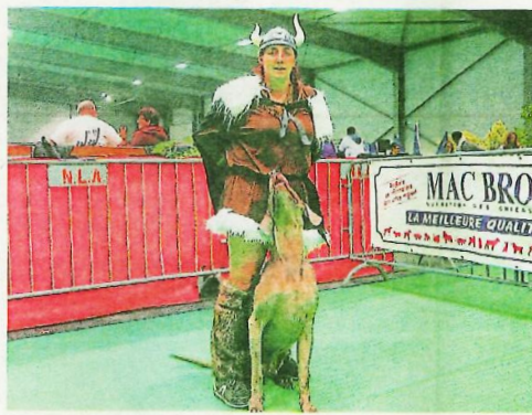
Au top pour prendre part à cette compétition.

Aujourd'hui Une compétition de dog dancing de haut niveau